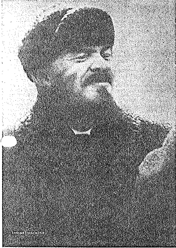
Lenin (oben) und Trotzki (unten), die beiden wichtigsten Führer der bolschewistischen Partei. Beide hatten die Anerkennung der Massen, weil sie stets hielten, was sie versprochen und weil sich ihre Ideen als richtig erwiesen.