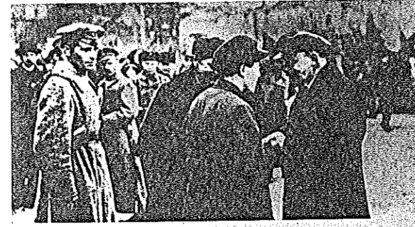
Erst Lenins Rückkehr ermöglichte den siegreichen Kampf für den Sozialismus.

Trotzki: Geschichte der russischen Revolution; Trotzki: Lehren des Oktober; Lenin: Briefe aus der Ferne (Werke Band 23); Reed: 10 Tage, die die Welt erschütterten.