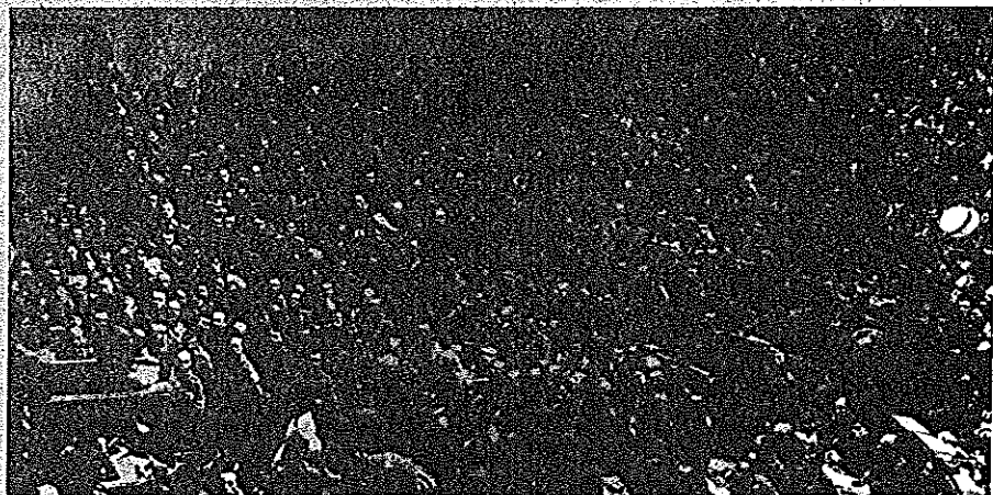
Arbeiterdemokratie: Der Petrograder Sowjet der Arbeiter- und Soldaten-Deputierten.

Leo Trotzki, der Vorsitzende des ersten Petersburger Sowjets 1905 und später neben Lenin führender Kopf der Oktoberrevolution, entwickelte schon weitergehende Perspektiven der zukünftigen Revolution. Er verneinte die Möglichkeit einer führenden Rolle der