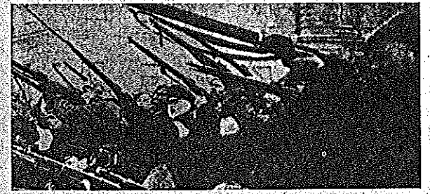
Gegen den imperialistischen Krieg, für den Sozialismus: Arbeiter und Soldaten kämpfen gegen ihren gemeinsamen Feind, das Kapital.

Aber erst nach seiner Rückkehr - mit dem legendären plombierten Waggon durch Deutschland - am 3. April konnte er direkt eingreifen. In seinen berühmten „Aprilthesen“ vom 4. April nahm er den Kampf gegen die versöhnliche Linie der leitenden Petrograder Bolschewiki auf. Er forderte: Kampf gegen die Politik der Vaterlandsverteidigung, Erringung der Mehrheit in den Sowjets, revolutionäre Friedenspolitik, sozialistischer Umsturz in Rußland als unteren Schichten der Revolution. Auf der gesamt-russischen Parteikonferenz der Bolschewiki Anfang April, zu der Lenin, nach seiner Ankunft stößt, verteidigt er seine Thesen. Tags zuvor war dort nicht nur über die Bedingungen der Unterstützung der provisorischen Regierung, sondern sogar über eine Verschmelzung der Partei mit den Menschewiki diskutiert worden. Gegen Lenins Thesen traten nicht wenige prominente Bolschewiki der „alten Garde“ auf. Sie klammerten sich nach wie vor